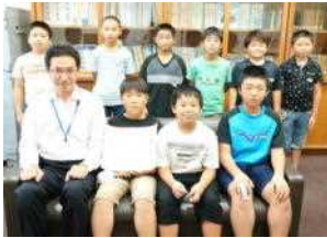
第52回秋田県小学校クラブ野球記念大会男鹿市予選大会