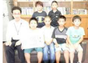
第20回東北学童軟式野球新人男鹿市予選大会