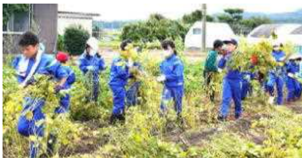
【縦割り班ごとに収穫作業】

今年も9月8日に学校菜園でだだちやまめの収穫がありました。縦割り班ごとに活動し、各班の畝の豆を刈り取ってブルーシートの上に集めると小山のようになりました。収穫後は学校運営協議